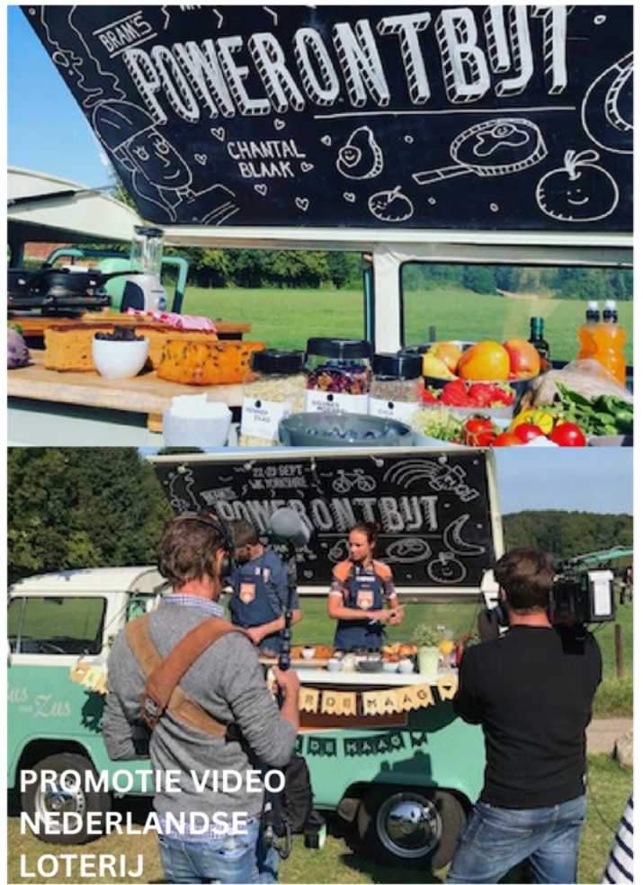
PROMOTIE VIDEO NEDERLANDSE LOTERIJ