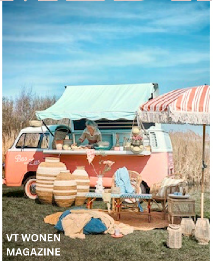
VT WONEN MAGAZINE